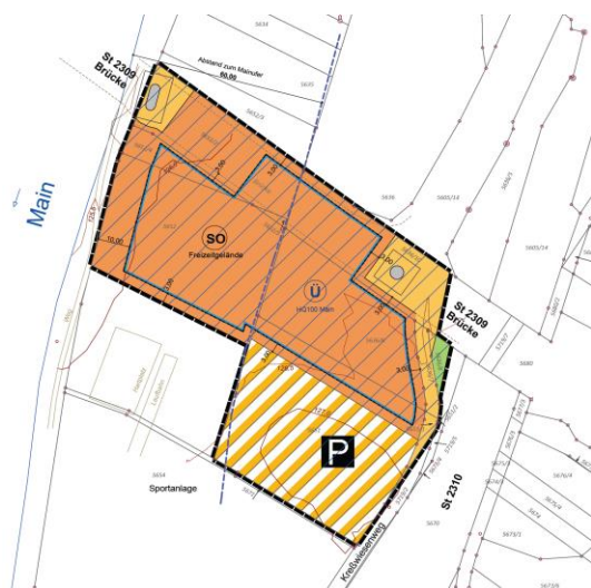
Bebauungsplanentwurf vom 08.10.2024

Der Marktgemeinderat hat in seiner Sitzung vom 08.10.2024 den Aufstellungsbeschluss für den Bebauungsplan „Freizeitgelände an der Martinsbrücke“ gefasst. Um den ersten Verfahrensschritt mit der frühzeitigen Beteiligung durchführen zu können, werden dem Gemeinderat die Pläne der beiden Bauleitpläne zur Billigung vorgestellt.